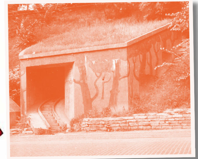
Bilden ovan visar värn H 58 vid krigsslutet 1945. Värnets väggar är dekorerade med träd i ett försök att få värnets betongväggar att smälta in.