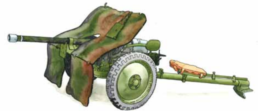
37 mm pansarvärnskanon modell 1938.