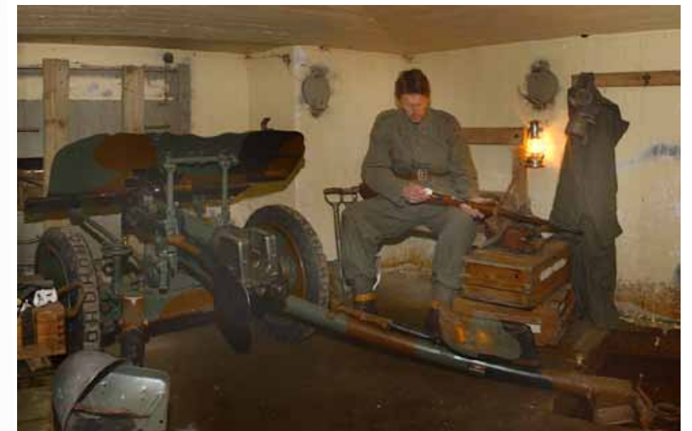
Pansarvärnskanon modell 1938 på plats i värn H 1 (rekonstruktion).

spräng- och 25 st rökhandgranater. Värnets observationshuv var avsedd för en soldat som för sin förbindelse hade ett talrör ner till värnbesättningen. Kommunikation skedde med tal medan man för anropssignal använde visselpipa i talröret. I värnet fanns även en kokseldad kamin, 50 liter dricksvatten, en låda med 18 portioner reservproviant samt en konservöppnare. För ventilation och frisk luft fanns ett handvevat ventilationssystem. Yttre kommunikation skedde med en ordonnans eller en fälttelefon. Betongtjockleken i väggar och tak är ca 1,10 meter, vilket skulle motstå kraftig beskjutning och flygbombning.