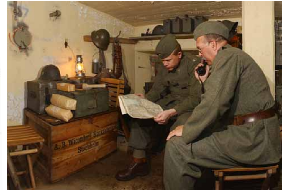
Värninteriör i värn H 1 (rekonstruktion).