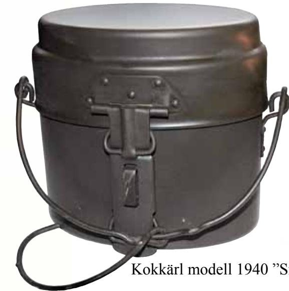
Kokkärl modell 1940 "Snuskburk".