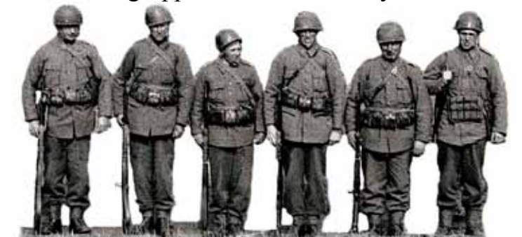
En skyttegrupp om sex soldater.

skottfältsområden. Försvaret fick istället baseras på rörliga förband som kunde grupperas i dessa små skyddsrum/värn.