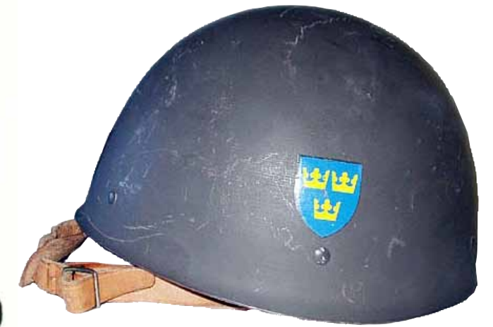
Hjälm modell 1937.