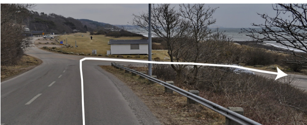
700 m. Stranden. Höger. Parkering 300 m.