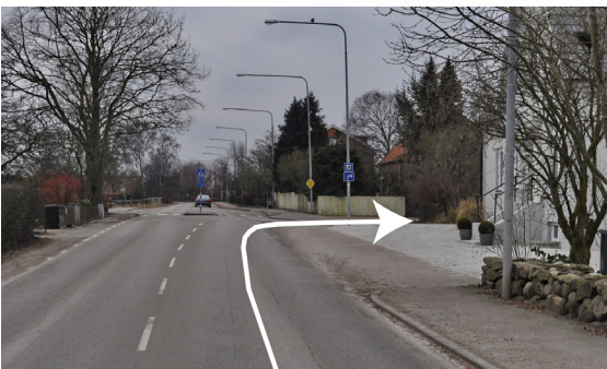
2,6 km. Vandrarhem. Höger