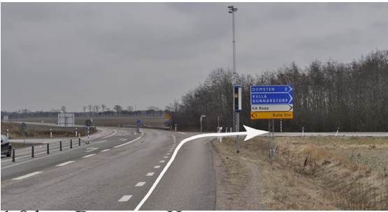
1,8 km. Domsten. Höger