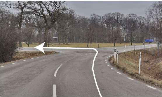
100 m. Laröd. Vänster