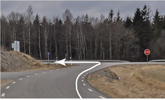
Från BM 1,6 km till väg 111. Vänster